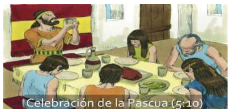
Celebración de la Pascua (5:10)