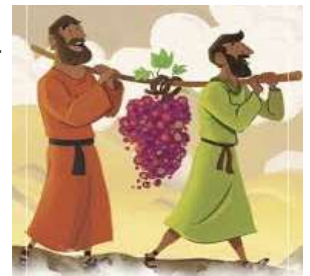
Joshua and Caleb

CONCLUSION: Dios quiere que pongamos nuestra confianza plena en él, debemos de aprender a somete honrarlo y obedecerlo, recordemos que él tiene un propósito en la vida de cada uno de nosotros, así que, aunque tu compañerito te diga que no lees la biblia, que no ores o quiera alejarte o convencerte de lo contrario, tú lo que debes hacer es confiar en Dios.